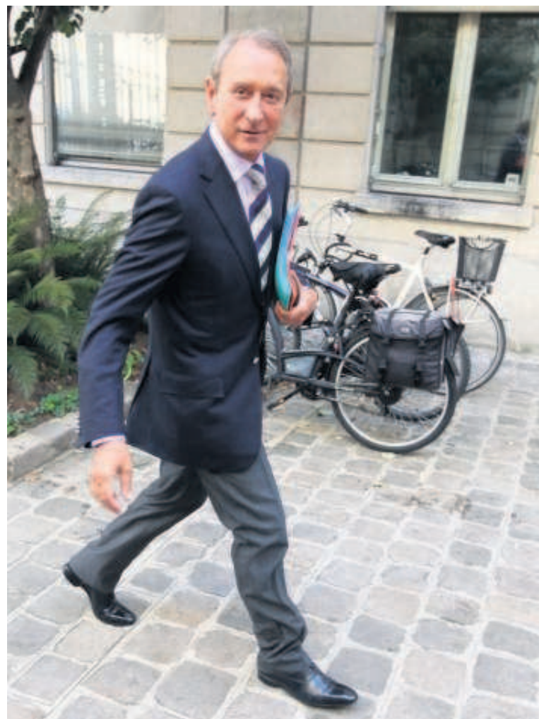
Malgré des moments difficiles Bertrand Delanoë n'a pas dévié de ligne et compte continuer à appliquer le programme sur lequel il a été réélu en 2008.

www.leparisien.fr www.aujourd'hui.fr ARCHIVES VIDEO Les temps forts du mandat